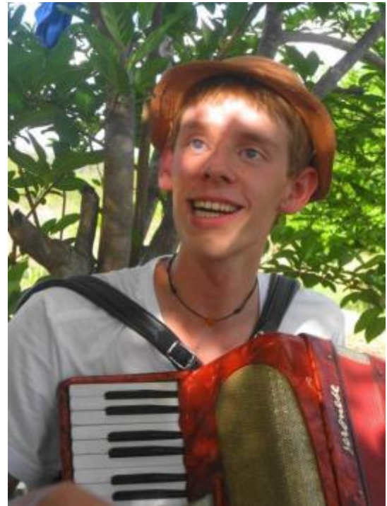
Nur wer dabei war versteht es!

Als ich hier in Sumé angekommen bin, haben mich die Leute zuerst angeschaut, als ob ich vom Mond käme: Meine (natürlichen) blonden Haare und meine weiße Haut haben zuerst für ziemliche Aufruhr gesorgt, da diese Eigenschaften an den Brasilianern im Cariri recht selten aufzufinden sind. Die Betonung liegt allerdings auf natürlich: Einmal hab ich eine farbige Frau gesehen, die blonde Haare auf dem Kopf und an den Armen hatte. Diese ungewollte Aufmerksamkeit hat mir indirekt geholfen, mich im lokalen Leben zu integrieren. Die Leute vor Ort fanden es toll, mit mir zu reden und mich unendlich viele Dinge zu fragen.