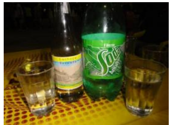
Nicht zu tief reingucken ...