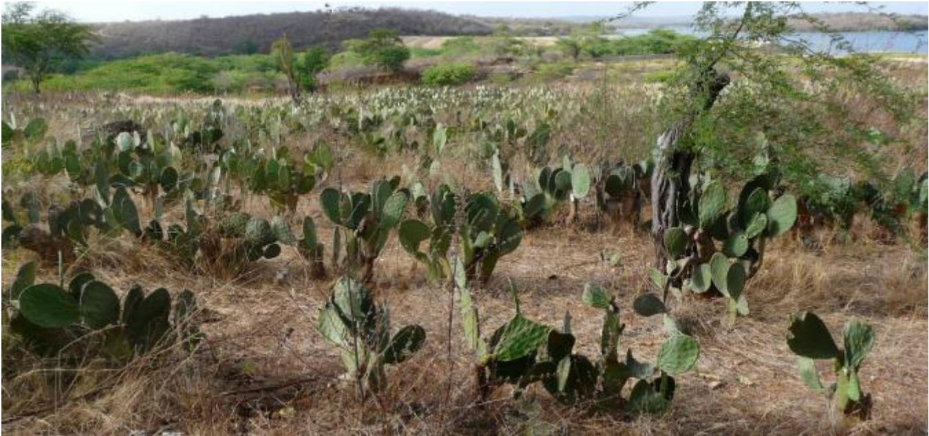
Es geht aufwärts in Sumé. Aber es werden weiterhin Kakteen angepflanzt: wenn man ihnen die Stacheln auszupft, dann können sie klein geschnitten und an Vieh verfüttert werden. Es gibt auch immer noch Menschen, die sie kochen und essen.