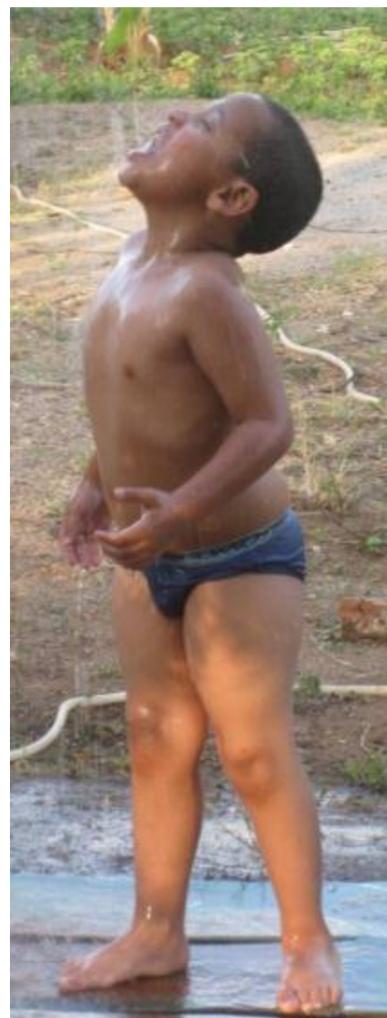
Dusche bei einer Farm außerhalb von Sumé. Wer es nicht gewöhnt ist sollte das Brunnenwasser nicht trinken.