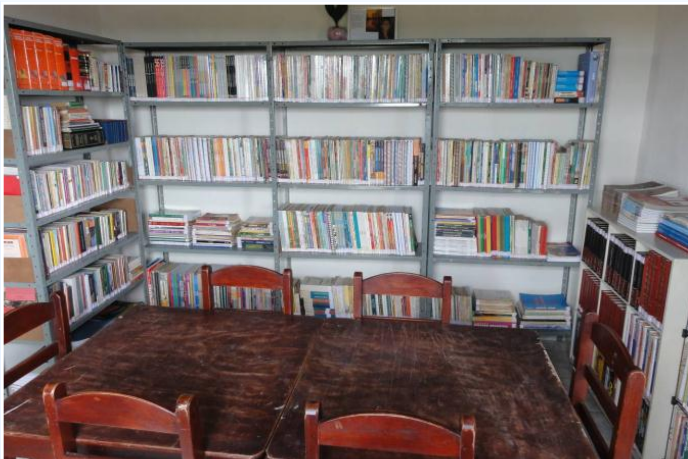
Der neue Studienraum von Educara – mit viel Liebe von den Stipendiaten eingerichtet.