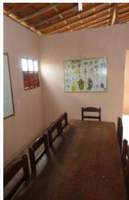
Der neue Studienraum – einer von drei Räumen.

Wir schaffen gerne Platz für das Banner Ihrer Firma!