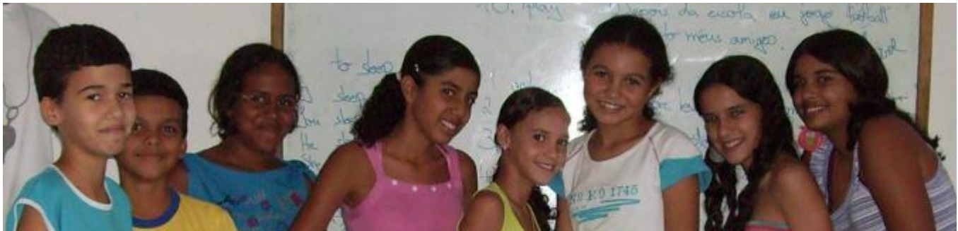
In der Sala Educara.

Zusammenfassend kann ich sagen, dass ich mich hier sehr wohl fühle und viele tolle Erfahrungen machen kann.