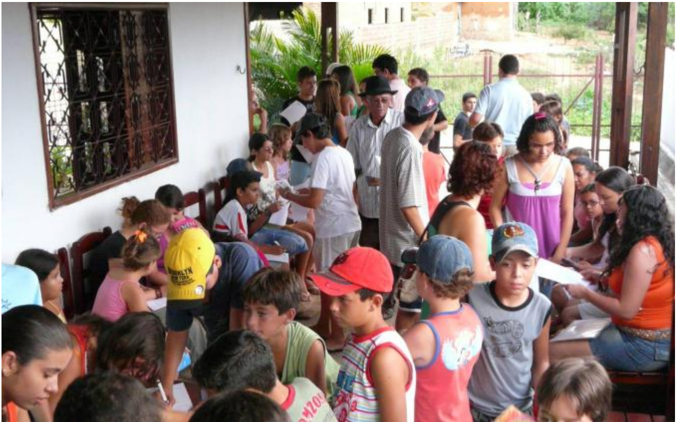
Einmal mehr: Vollversammlung bei Educara.