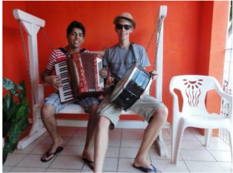
Música, Musik, musique, music – egal wie man es nennt: alle wissen, was gemeint ist, oder?

Hier wird zusammen musiziert, gesungen, sich gemütlich zusammengesetzt und unterhalten. Natürlich gibt es auch viel Alkohol, denn hier aus Paraíba kommt der Cachaça der halben Welt. Eine ein Liter Flasche „Pitu“ Zuckerrohrschnapses kostet umgerechnet nur 2€. Nun ist aber die soziale Art des Trinkens sehr unterschiedlich als bei uns: Bei uns kommt beispielsweise der Kellner oder die Kellnerin einer Bar an den Tisch und nimmt die Bestellung für die jeweiligen Personen auf. Hier ist es folgendermaßen: Die Personen an einem Tisch einigen sich vorher auf ein bestimmtes Getränk. In den meisten Fällen fällt die Entscheidung auf „Triunfo“ – Cachaça aus einer Fabrik in einer nahegelegenen Stadt. Dann kommt also eine Flasche auf dem Tisch (die Flaschen ähneln unseren Bierflaschen mit Kronkorken) und jeder hat ein Glas und ein weiteres Glas mit einem Erfrischungsgetränk steht in der Mitte des Tisches.