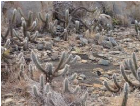
Die Wüste lebt!